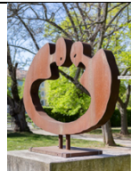
ALBRECHT GENIN Verbindung, 2002