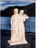
JOHANN GOTTFRIED SCHADOW Prinzessinnengruppe, 1796/2025