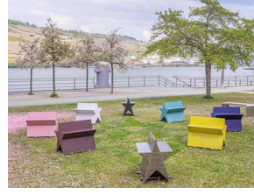
BA SELA Kern-Konstrukt 8, 2026

Bildrechte liegen bei den Künstler*innen und Fotografen, außerdem: