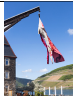
NADINE SCHEMMANN Matronengeflüster (Erde, Wind, Wasser), 2026