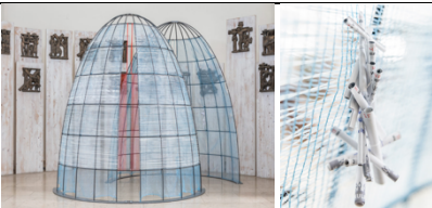
HALEH REDJAIAN Underneath the arches, 2026 Fotos: David von Becker; © VG Bild-Kunst, Bonn 2026