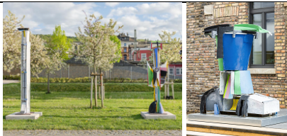
MENNO FAHL Straßenfeger, Stadtvogel und Krallenbüste, 2025