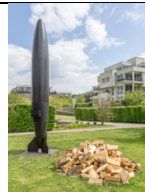
MICHAEL SAILSTORFER Brenner R04, 2026 Fotos: David von Becker; © VG Bild-Kunst, Bonn 2026