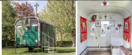
SASHA KURMAZ The Temple of Transfiguration of the Lord, 2026