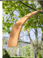
THUY TIEN NGUYEN Slickly slide for super strong spine, 2023