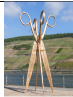
VALIE EXPORT Die Doppelgängerin, 2010 Foto: David von Becker; © VG Bild-Kunst, Bonn 2026, Courtesy the artist and Galerie Thaddaeus Ropac, London · Paris · Salzburg · Milan · Seoul