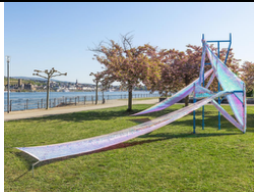
BETTINA ALLAMODA Outdoor Wrap (Slim)/ Cherry Blossom, 2026

Alle Pressebilder können auf der Webseite www.skulpturen-bingen.de heruntergeladen werden