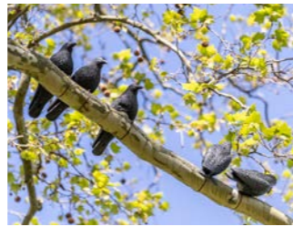
NR. 18 THOMAS JUDISCH Too many birds #16, 2026

Bildrechte: © liegen bei den beteiligten Künstler*innen; EXPORT © VG Bild-Kunst, Bonn 2026; Courtesy the artist and Galerie Thaddaeus Ropac, London · Paris · Salzburg · Milan · Seoul; Allamoda, Fahl, Redjain, Sailstorfer: VG Bild-Kunst, Bonn 2026; Klasse Baumgartner und Gäste: Sojeong Kim; Schadow: (c) KPM, Königliche Porzellan-Manufaktur, Berlin GmbH; Schemmann: Courtesy the artist and Galerie Norbert Arns, Köln