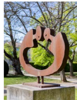
NR. 13 ALBRECHT GENIN Verbindung, 2002