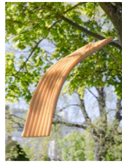
NR. 12 THUY TIEN NGUYEN Slicky slide for super strong spine, 2023 (or on looking at chronological back pain)