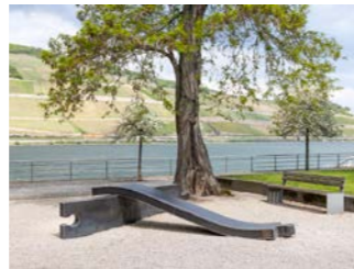
NR. 16 MAX BRÜCK Stand by me, 2026