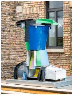
NR. 24 MENNO FAHL Große Krallenbüste, 2025