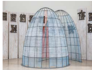
NR. 21 HALEH REDJAIAN Underneath the Arches, 2026