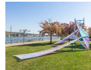
NR. 01 BETTINA ALLAMODA Outdoor Wrap (Slim)/ Cherry Blossom, 2026