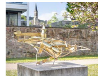
NR. 07 KARSTEN KONRAD IGM I, 2018