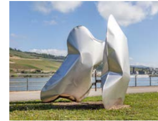
NR. 03 HANNAH HALLERMANN SK ADJUSTER, 2026