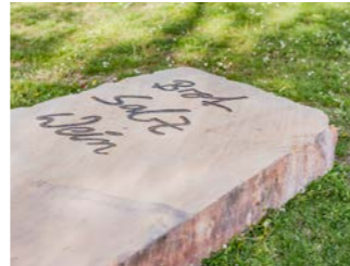
NR. 14 THOMAS JUDISCH Brot und Spiele, 2026