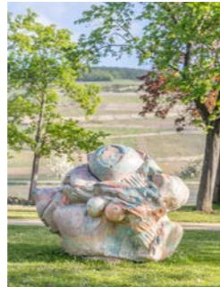
NR. 17 EMILIA NEUMANN UG.P I, 2025/2026