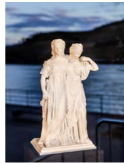
NR. 11 JOHANN GOTTFRIED SCHADOW Prinzessinnengruppe, Entwurf 1796/2025