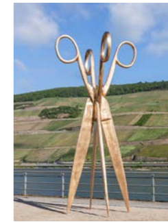
NR. 05 VALIE EXPORT Die Doppelgängerin, 2010