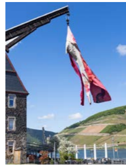
NR. 10 NADINE SCHEMMANN Matronengeflüster (Erde, Wind, Wasser), 2026