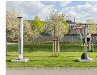
NR. 09 MENNO FAHL Großer Straßenfeger & Stadtvogel, 2025