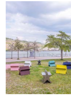
NR. 04 BA SELA Kern-Konstrukt 8, 2026